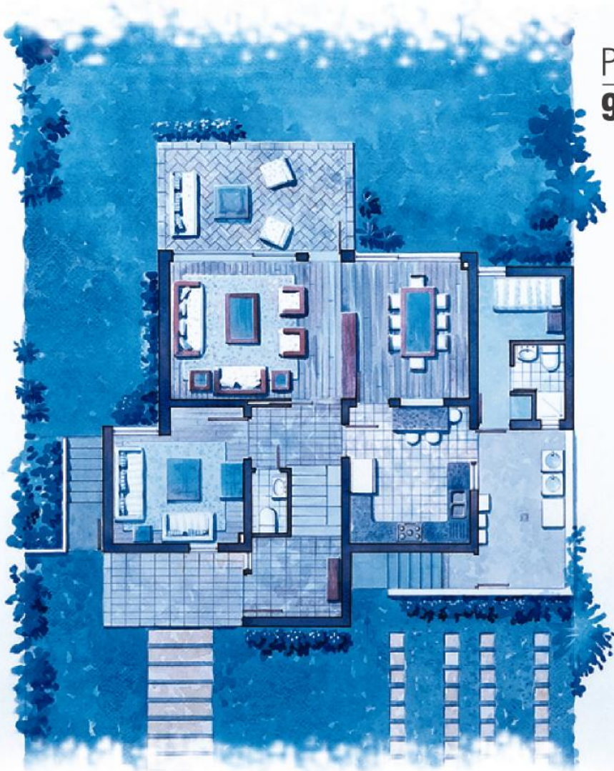
Primer Piso 96,27 m 2