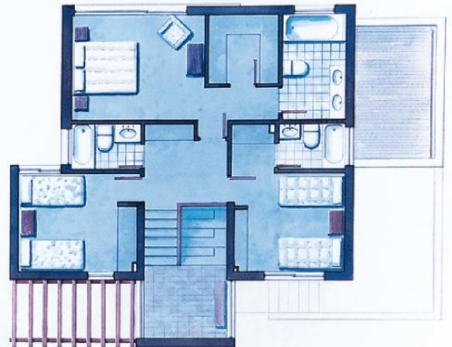
Segundo Piso 73,81 m 2